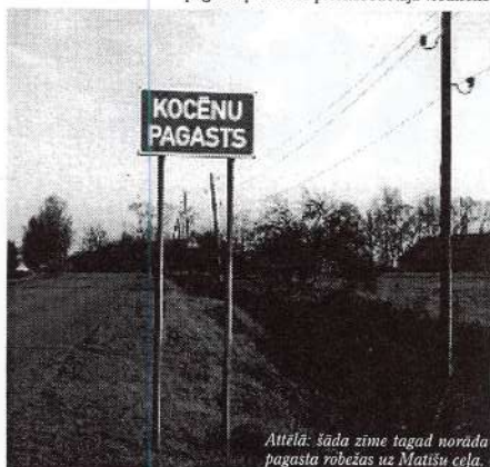
Attēlā: šāda zīme tagad norāda pagasta robežas uz Matīšu ceļu.

JĀNIS OLMANIS, pagasta padomes priekšsēdētāja vietnieks