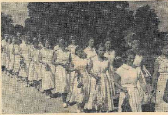
Skan maršs, soļo jaunatne — un viņā ar prieku, ar svētīgu satraukumu noraugās simtiem pilsētas un tās apkārtnes iedzīvotāju.

Jauniešu pilngadības svētkos Mazsalacā piedalījās apmēram simts jauniešu no dažādām rajona vietām — no Rūjienas un Mazsalacas, no Austrumu padomju saltniecības un kolhoza „Auseklis”, no Naukšēniem un Idus. Liksmi, skaisti un saulaini bija šie svētki. Tie ilgi jo ilgi paliks gan jauno garšnieku, gan viņu draugu, biedru un paziņu atmiņā.