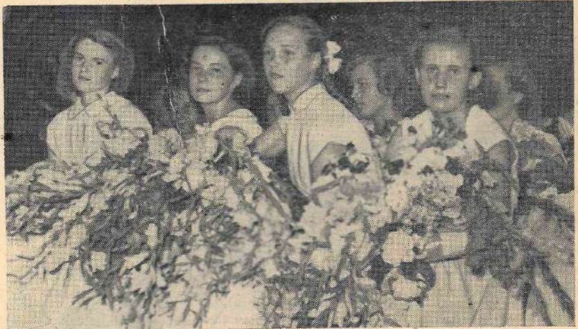
„Steidzas laiks, un, pašiem nemanot, viņi atkal ir piegājuši solī tuvāk tai rūdienai, kuru ikvienu sauc un aicina mūsu jaunības gadī”.