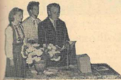
Un, lūk, sākusies pilngadības apļecību izsniegšana.