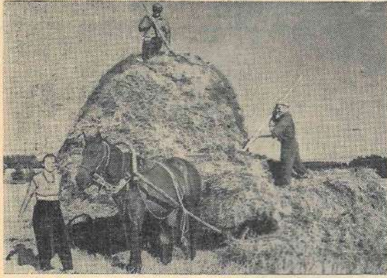
Attēls: medicīnas institūta studenti kolhozā „Straume” savāc kombainu salmus.

Lai ātrāk novāktu kolhoza laukos pirmā septiņgades gada bagāto ražu, kolhozniekiem talkā devās pilsētu rūpniecības uzņēmumu strādnieki, testāžu darbinieki un mācību iestāžu audzēkņi. Čakli palīgi kolhozos „Sarkanā zvaigzne”, „Salaca”, „Skaņaiskalns”, „Vienība”, „Rosme”, „Uzvara”, „Rūja”, „Stars”, „Straume” un Kirova kolhozā bija medicīnas institūta audzēkņi.