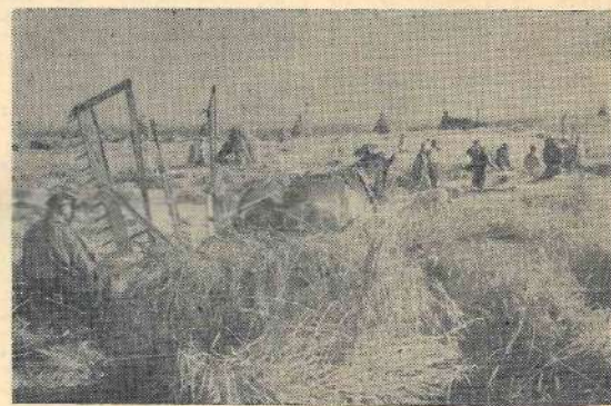
Attēlā: novācot bagātīgo ražu ar trim plaujmašīnām, krietni vien bija jāpacinās arī laukkopjiem.

Lielas grūtības laukkopjiem sagādāja izaudzētās ražas novākšana. Rudzu garums pārsniedza divus metrus, un tos sasiēt bija pa spēkam tikai kūlišu sējējam,