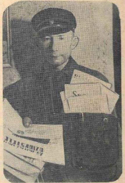
— Lūdzu, — tas ir viņa pirmais vārds.