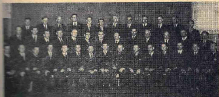
Mazsalacas vīru koris „Dziedonis”.

Lai pārbaudītu, kāds ir kora skanējums, rit „Dziedonis” dodas koncertēt uz Pērnavu, kur Pērnavas meža kombināts rīko dziesmu dienu. Lai jo vairāk iepriecinātu īgaunu klausītājus, koris Keņiņa „Meklētājus” iemācījis arī īgaunu valodā.