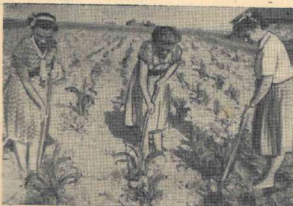
Kukurūza. Pavasarī, protams, tā vēl bija sīka un niecīga, bet, esmēlusies saules siltumu un augšnes valgumu, tā raisīja lapu pēc lapas. Tagad tās garums sniedz savu kopēju un rušīnātāju garumu.

Kolhoza „Auseklis” komjaunieši uzņēmas šo vērtīgo zaļbarības kultūru audzēt viena hektāra platībā, taču viņi palīdzējuši apkopt arī 26 ha šefības lauku. Daļu nezāļu viņi izmīcināja, izdarot lauku apmīglošanu ar herbīdiem, bieži paši devās uz lauku kolektīvi un veica lauku rušīnāšanu.