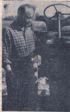
Kaļiņina koposaimniecībā šogad laba iegūto zālāju stena raža.