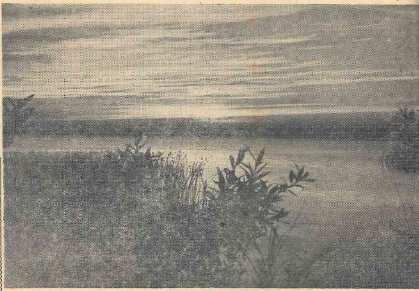
Burtnieku ezers saulrietā