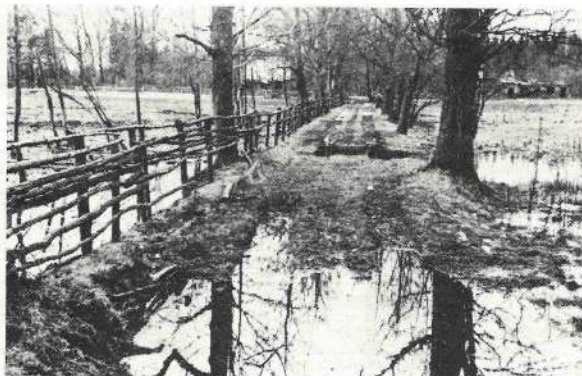
To nevar piedot ne cilvēki, ne Dievs.