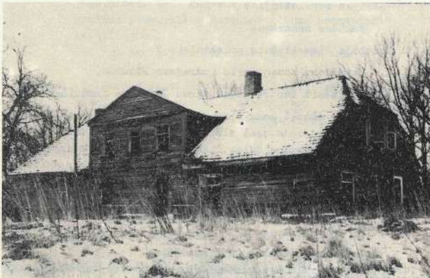
"Tīlikas" - vienas no skaistākajām, turīgākajām Romatas ciema mājām. Bija.

Kā notika saimniekošana pēc tam, par to, lai liecina šie fotomateriāli. Kādreiz sakām: "Liktenis."