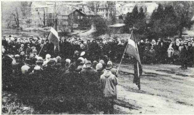
1991.gada 25.marts Mazsalacā

Uz 1991.gada 1.janvāri PSRS bija 290,1 miljoni cilvēku. To skaits, kuri vecāki par 18 gadiem - 200,5 miljoni. Balsis tiesības ir 196 miljoniem. 17.marta referendumā 111,3 miljoni atbildēja "jā" (57 % PSRS pilsoņu, kuriem ir balsis tiesības). 34,5 miljoni teica "nē" vai viņu biļetenī atzīti par nederīgiem. 1991.gada 17.marta referendumā nepiedalījās vairākums Lietuvas, Latvijas, Īgaunijas, Gruzijas, Armēnijas, Moldovas iedzīvotāju.