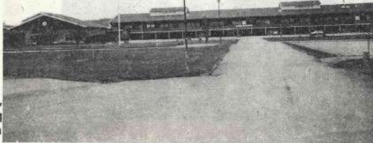
● Venersborgas ģimnāzija.