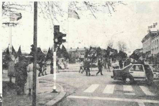
• L. maija demonstrācija ar mums "mīļiem" karogiem.