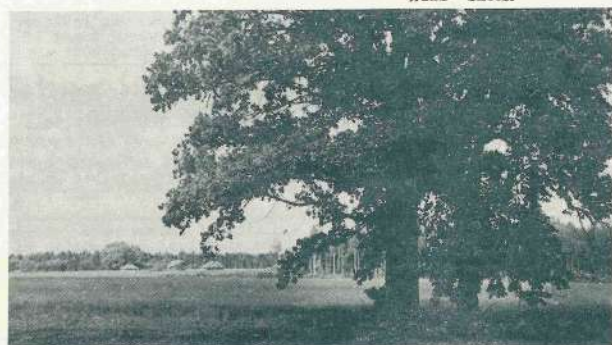
Skats no bijušajām Jaunkaktiņu mājām.