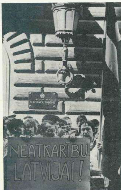
(1990.g. 4. maijs)