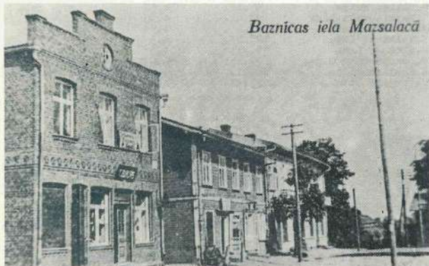
Baznīcas iela Mazsalacā