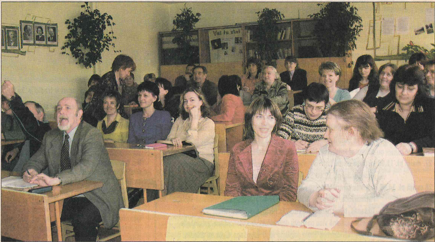
Mazsalacas vidusskolas skolotāji, sasēduši skolas solos, ar vieglu satraukumu gaida pirmo skolas novērtējumu.

Šogad skolā pavasaris atnāca ar sevišķi lielu gatavošanos, kā arī nelielu satraukumu, jo kā nu ne — eksāmens vārdā „akreditācija” bija jāliek visai skolai.