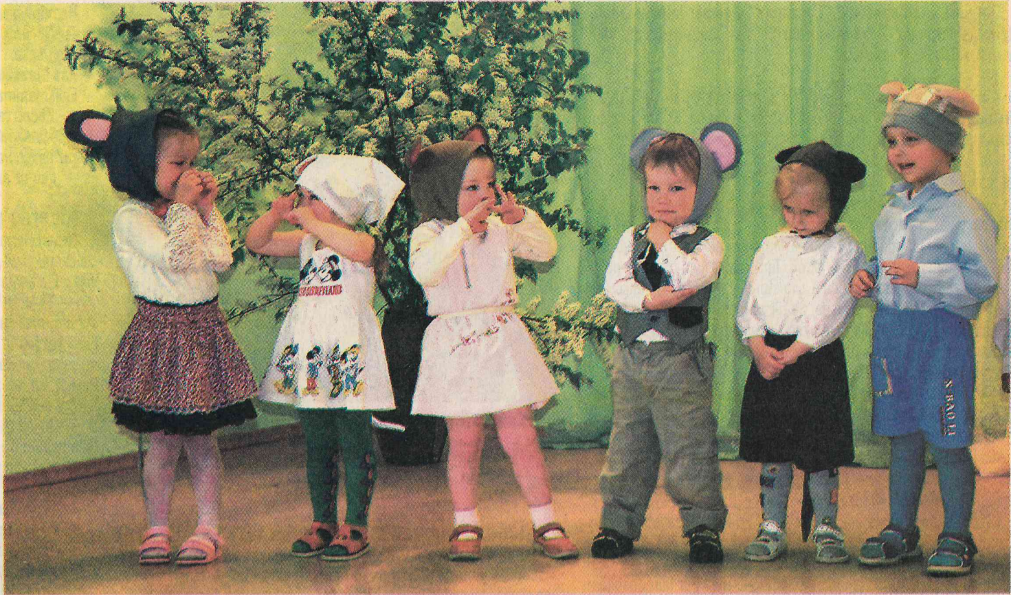
Savas māmiņas bērnodārzā sveica arī paši mazākie bērnodārza audzēkņi.

Svētdien beidzot bija klāt gan pirmais pavasara lietus, gan arī ilgi gaidītā Mātes diena. Mātes dienai veltīts dievkalpojums notika Mazsalacas baptistu baznīcā, kur svētrunu teica Liepājas