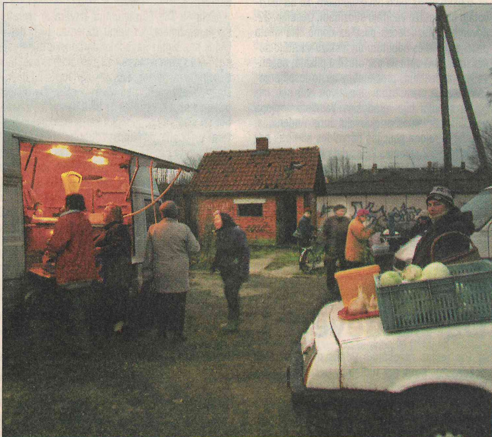
ŠOBRĪD TIRGUS MAZSALACĀ TĀDS PAŠKĪDRS. Tomēr iedzīvotāji būtu gatavi pat piemaksāt, lai tas būtu.

Tirgošanās šai dārzeņu pārdevējai nozīmējot pat ļoti daudz. Pavasaros viņa tirgojot puķu stādus, sa-lātus, uz rudens pusi dārzeņus – ja cilvēki zinātu,