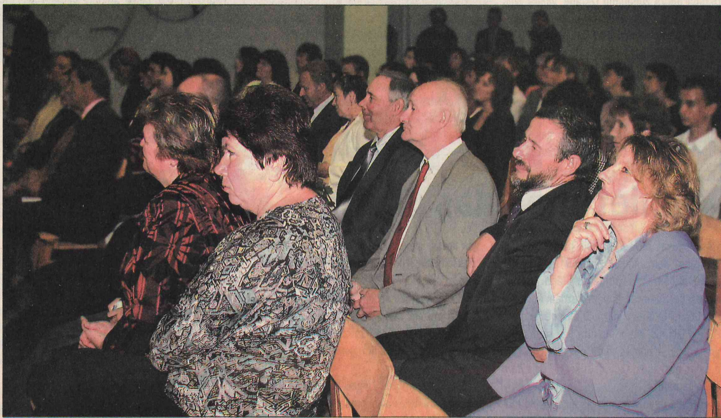
Skolas 30 gadu jubilejas koncertu klausīties bija sanākuši bijušie un esošie darbinieki, skolotāji un arī absolventi.

30. septembrī Mazsalacas vidusskola svinēja jaunās ēkas 30 gadu jubileju.