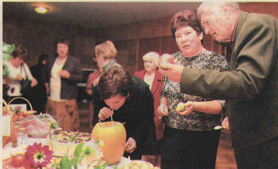
Miķeļdienas ražas svētkos varēja nobaudīt visdažādākos kulinārijas brīnumus.