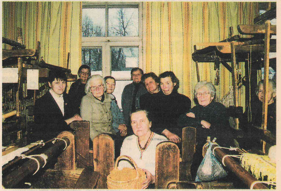
Aušanas studija vecās pagastmājas 2. stāvā.