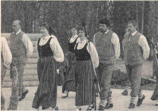
Viskoplāk apmeklētais Lieldienu pasākums šogad bija Vecatē, kur estrādē pulcējās tuvu simt vecatiešu. Viņus priecēja arī Skaņkalnes/Mazsalacas apvienotais deju kolektīvs.