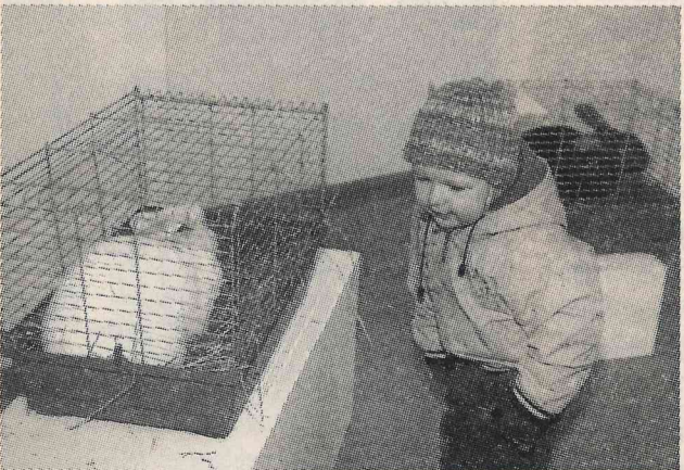
Mazajiem mazsalaciešiem vislielāko prieku sagādāja zemnieku saimniecībā "Dzintari" mītošie truši. Dažs pat 7 kilogramus smags.