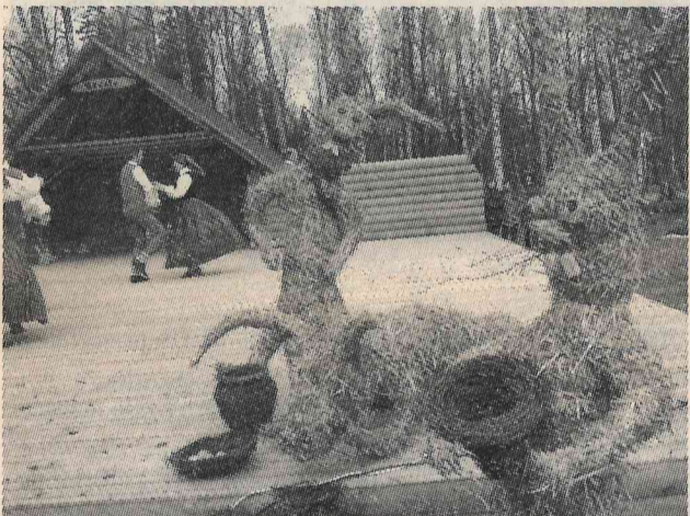
Kas gan par Liendienām bez zaķiem?