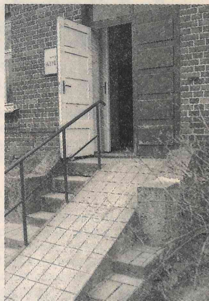
Kā tikt augšā cilvēkam ratiņkrēslā?

feldšeri. Ja viņi ir izbraukumā, slimnīcā ir nodaļa, kur māsiņa sniegs pirmo palīdzību un, ja nepieciešams, izsauks dežūrārstu. Galvenais ir nesamulst, ja, izsaucot neatliekamo medicīnisko palīdzību Mazsalacā pa tālruni 4251353, jums atbild Valmieras ātrā palīdzība. Mazsalacas feldšeri strādā zem Valmieras iecirkņa.