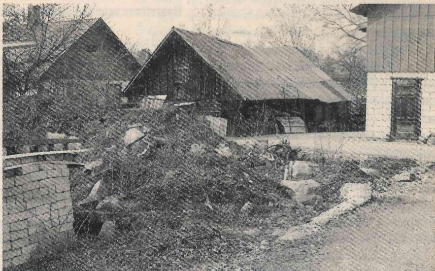
Avotu ielas iedzīvotāji stāsta, ka šīs mājas pagalmis jau sen nav kopts.