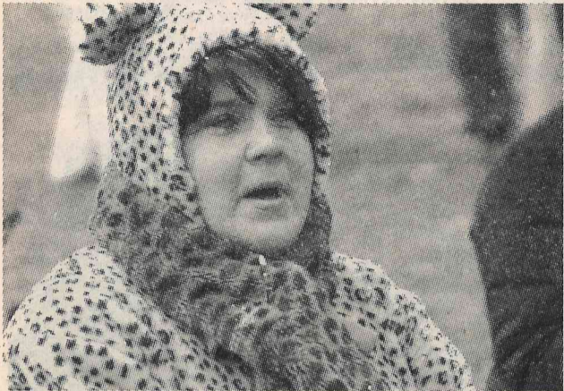
Dažs pret sniegu un vēju nodrošinājies labāk par citiem.