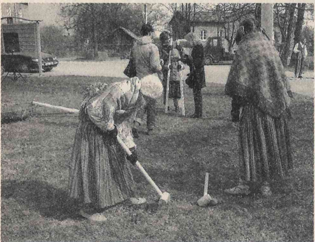
Mazsalacā Lieldienu pasākumu apmeklē vien paši drosīgākie.