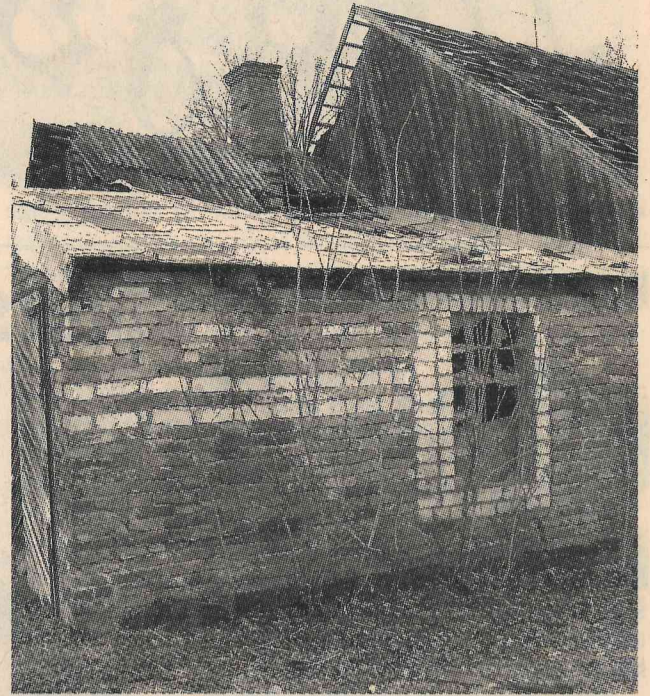
Vai šeit dzīvo cilvēki?