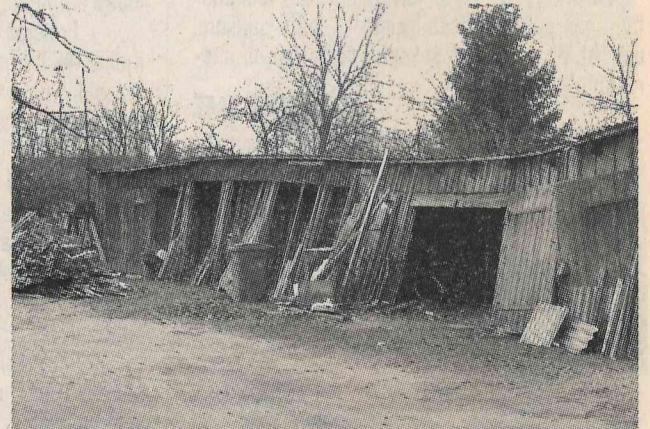
Vai nevajadzētu sazāgēt malkā?