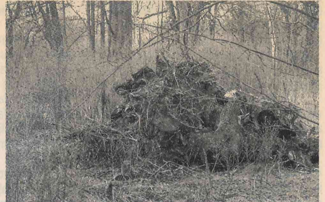
Apbūves gabalu, kurš pieder visai pazīstamai personai, šobrīd rotā vien būvgruži un celmi.