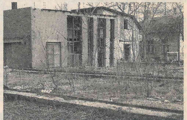
Ēka Sporta ielā.