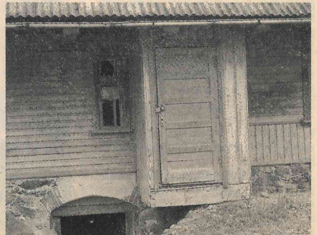
Iebraucot pilsētā, var redzēt arī tādas mājas.