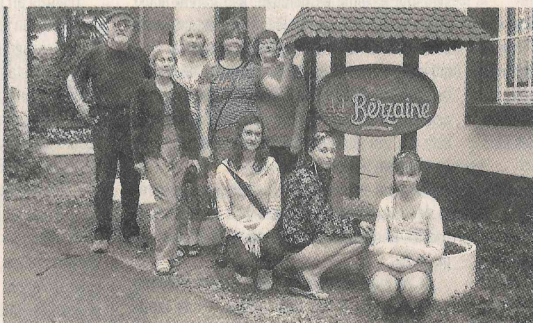
Folkloras kopas «Rāmsalaca» dalībnieki Freiburgā, turienes latviešu mītnē «Bērzaine».