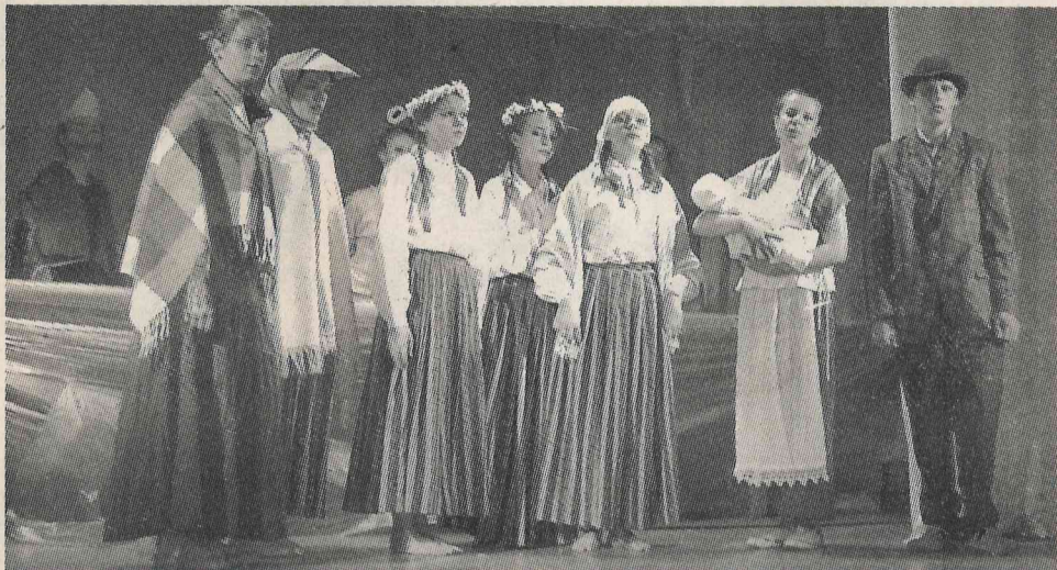
«Zalkšu līgavu» spēlējot uz Pēterburgas skatuves.