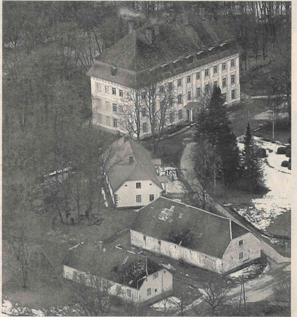
Valtenbergu muižu, iespējams, gaida pārmaiņām pilna nākotne.

Tomēr pats galvenais ieguvums būs Valtenbergu muižas un arī tai piederošo ēku (arī jau daudzus prātos «norakstītā» zirgu stallja) sakārtošana, restaurēšana un saglabāšana nākamajam paaudzēm, jo tādas naudas pašvaldībai nav un nebūs vēl ilgi. Jau tagad muižas ēkai steidzami nepiecie-