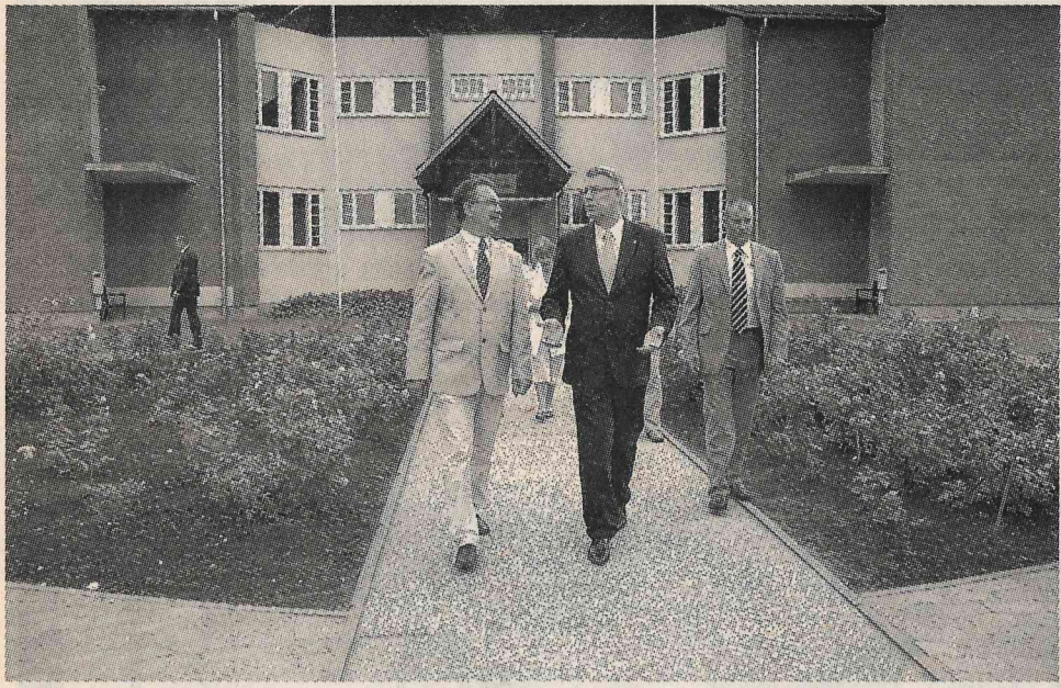
Vērtē ar mediķa aci.