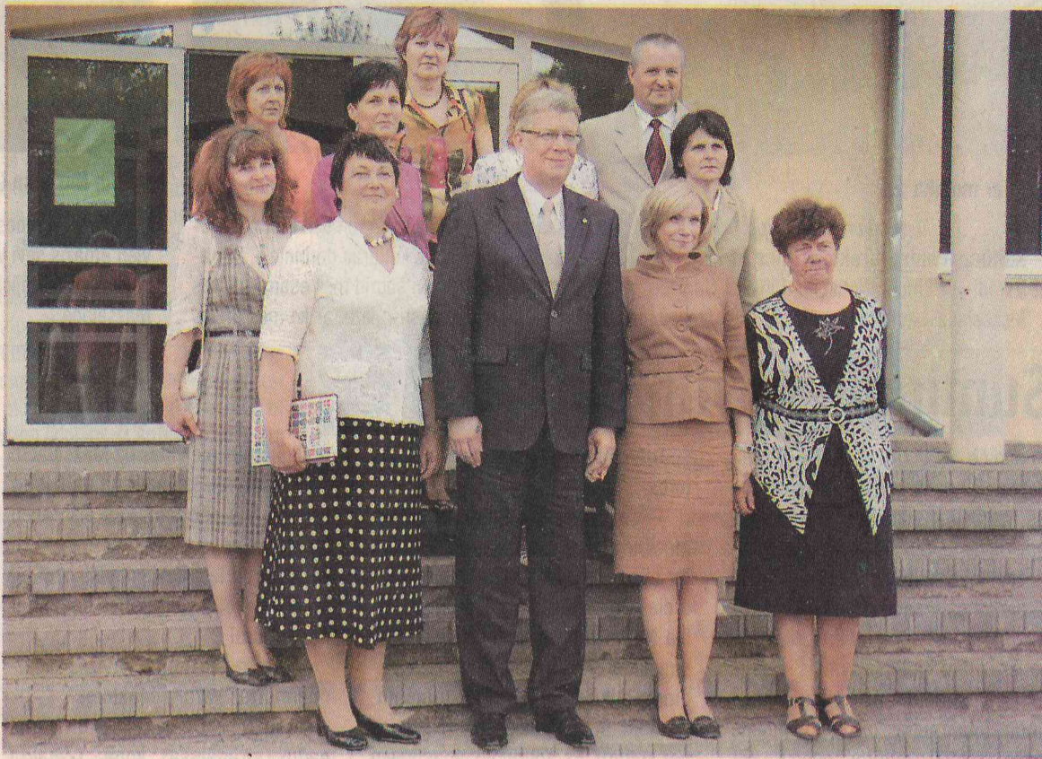
Izglītības jautājumi pirmajā vietā.

Prezidenta kungam demonstrējām mazliet citādāku medicīniskās un sociālās aprūpes modeli, nekā tas pieņemts Latvijā. Tā kā šis modelis pie mums veiksmīgi īstenots, krīze mūs ir