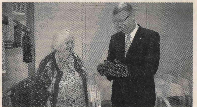
Der kā uzlieti! Prezidents pielaiko dāvanu.

atmosfēra ļoti laba. Prieks, ka adītājas tik uzcītīgas, ka redzams progress! Man pats svarīgākais šķiet nodot šo mākslu citiem. Lai arī es neesmu vienīgā, kas prot šādus cimdus adīt, katru gadu, braucot uz Brīvdabas muzeju tirgot cimdus, redzu, ka šādā tehnikā adījumu nav. Citi, piemēram, pat netic, ka šādus cimdus iespējams uzadīt. Tirgū man ir bijuši visādi kuriozi, bet vislabāk patika reize, kad kādi cilvēki, nopētījuši cimdus, atmeta ar roku: «Ā, šie jau ir ar mašīnu adīti!» Un neļdzēja teikt, ka mašīna šādus uzadīt neprot, ka tādiem vienmēr būs vile.