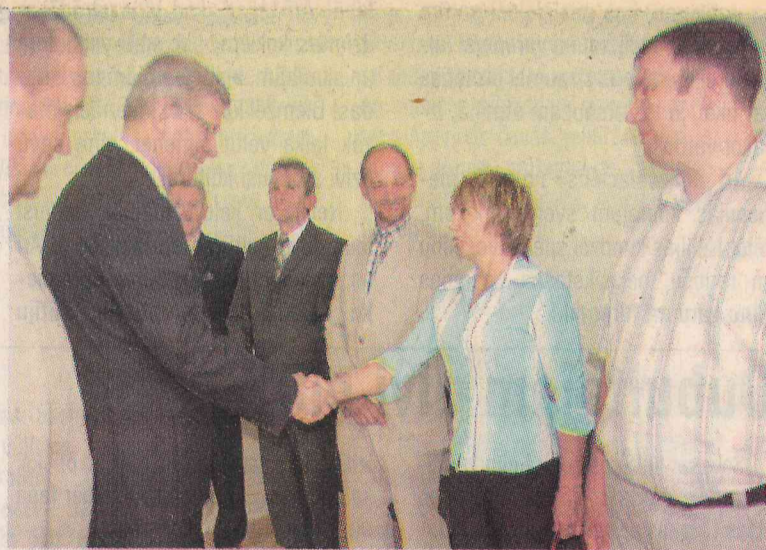
Sarunās ar uzņēmējiem, deputātiem

Esmu pateicīga par šo augsto vizīti mūsu novadā! Gribētos teikt, ka arī