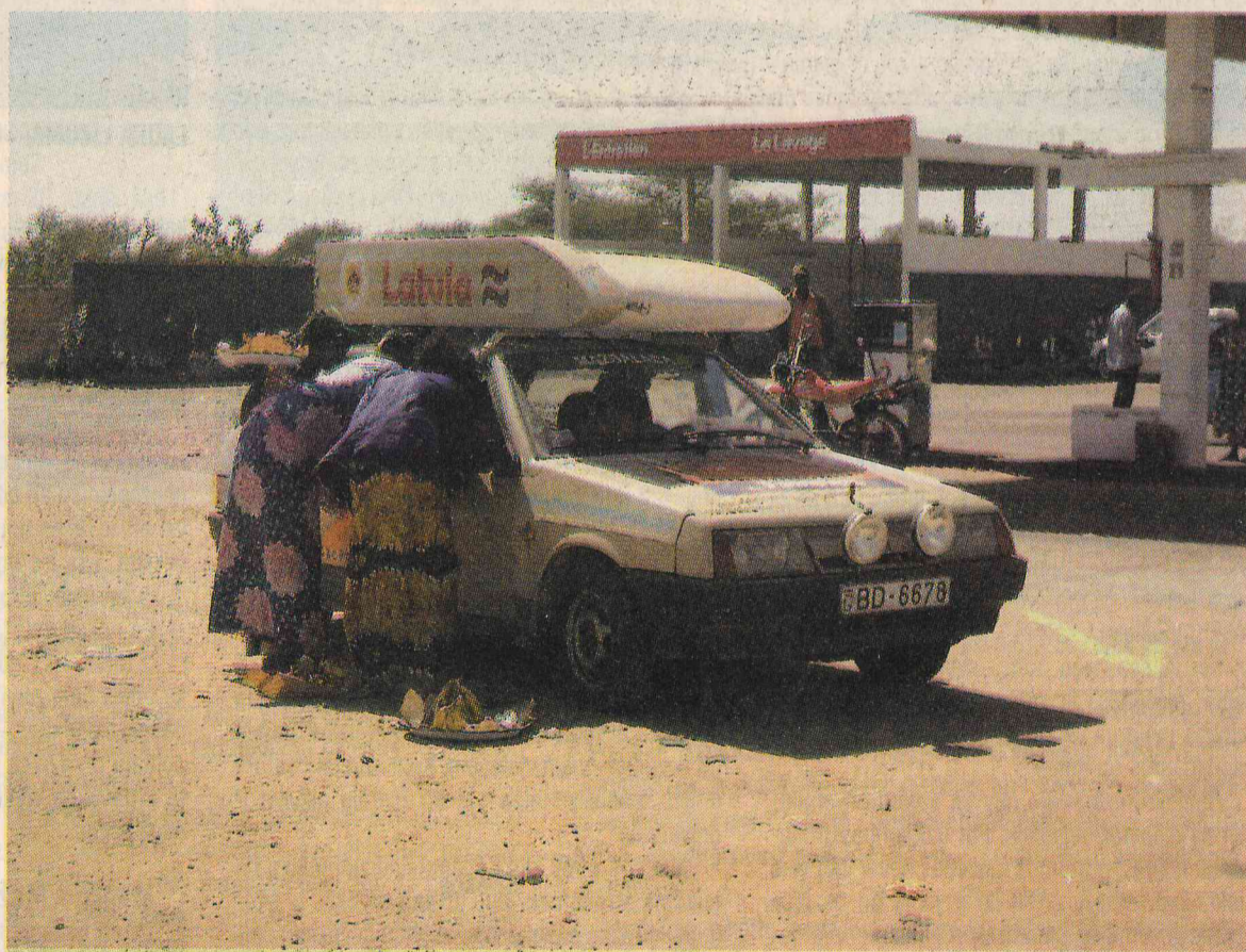
«Žiks» ceļo tālāk. Jau ar krievu tautības saimniekiem Senegālā — jaunās dēkās.

pakal tirgonis, lai aizvestu mūs uz lidostu. Iedodu viņam 100 eiro, lai nebūtu sarežģījumu ar zīmogu pasē. Tirgonis tiešām kaut ko sarunā ar formā tērptu vīru, un mūs ielaiž lidostā. Atvadāmies.