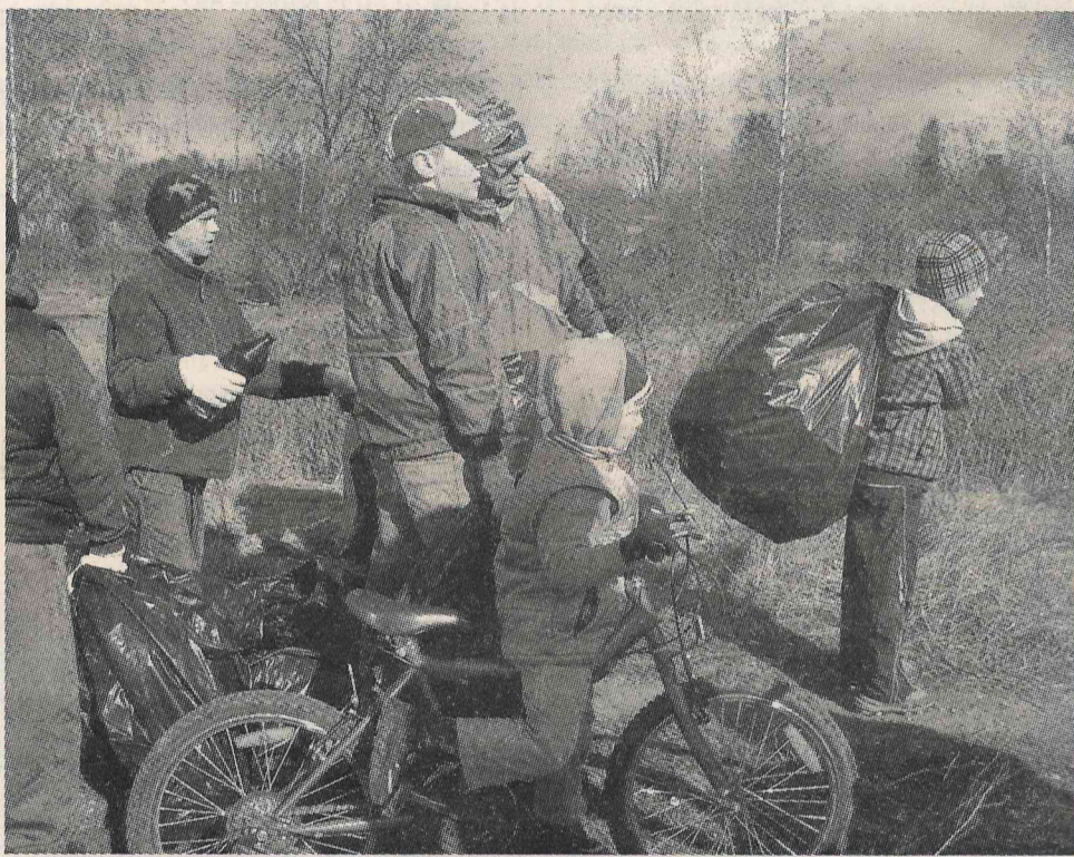
Daļa no čaklajiem talciniekiem.

Diemžēl, kaut arī pat nedēļa nav pagājusi, skoptajā dzelzceļa līnijas apvidū jau atkal piezēmējās cigarešu paciņas... Kāda jēga, prasīsiet? Kā atzīst kāda talciniece, «talka ir vienīgais veids, kaut arī prasa laiku, palīdzēt izaugt citai paaudzei ar citu domāšanu».