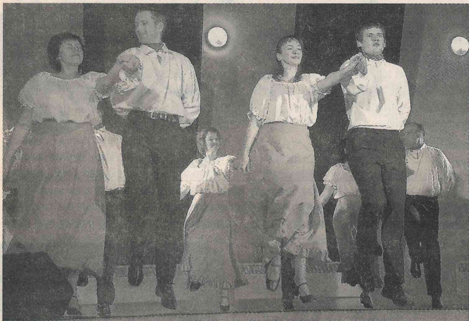
Mazsalacas vidējās paaudzes deju kolektīvs «Skaņaiskalns».

21. februārī Mazsalacas kultūras centra grīda atkal dabūja trūkties, jo izturēt astoņu kolektīvu deju kolektīvu korpju un zābaku papēžus 24 dejās nav joka lieta!