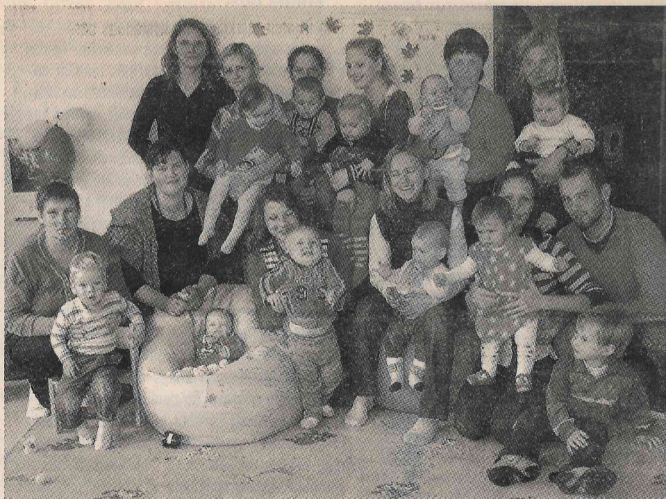
«Kamolīša» ritinātāji: no 3 mēnešiem līdz 3 gadiem!

23. septembrī ar jaunu sparū pēc vasaras brīvdienām darbību atsāka mazuļu skoliņa «Kamolītis».