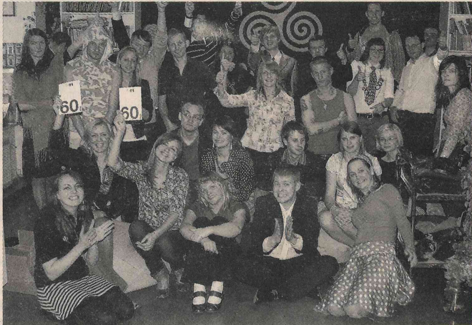
Jauniešu ministri — projekta kopbilde.