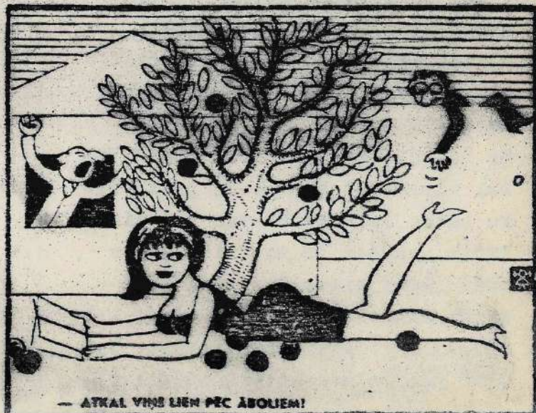
— ATRĀL VINS LIEN PĒC ĀBOLIEM!