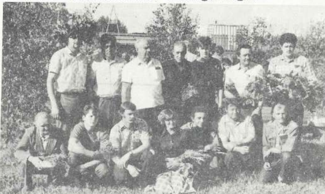
Jāņu rīta gavilnieki, cits ar kroni, cits...