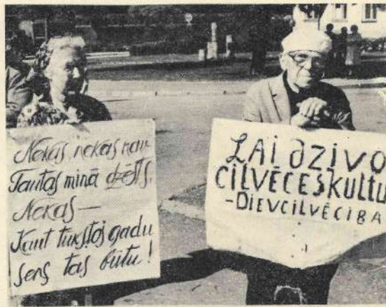
VALMIERA. 1989. GADA 17. JŪNIJS.