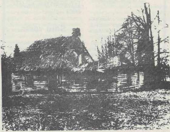
Lauku mājas Kauguru pagastā 1990. g. novembrī.