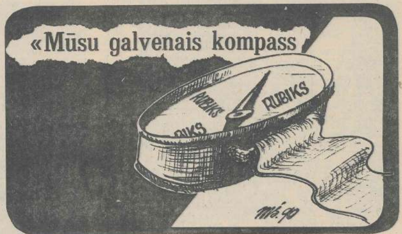
Māra Sverna zīmējums