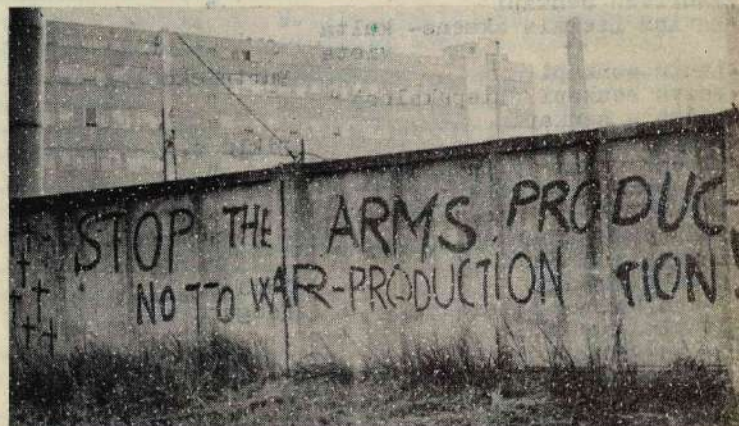
(attēlā: monumentālā plakāta fragments)

Akcijas radītās neērtības nav salīdzināmas ar to rūpniecisko noziedzību, kuras upuri esam mēs visi bez izņēmuma!