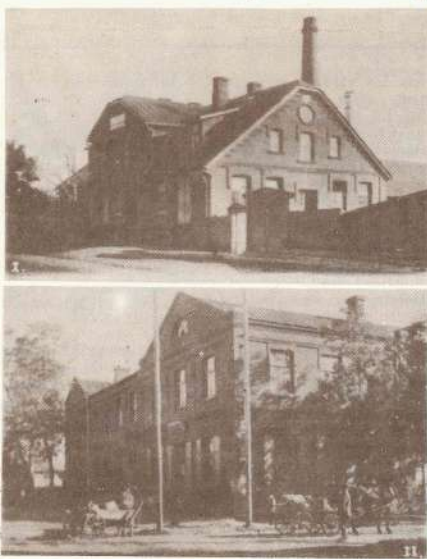
Rūjienas kopmoderniecība (pienotava) un Zemkopības biedrības nams. 1920-10. gadu foto.

caur zemes iepirkšanu, prasīgu saimniecisko, lauksaimniecības zinību apgušanu un darbošanos zemkopības biedrībā.