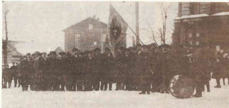
Mazsalacas un apkārtnes amatnieku biedrības parāde Mazsalacā, tirgus laukumā, Ap 1926.—1928. g.

Biedrība aktīvi piedalījās arī tās biedru ikdienas darba apstākļu un sadzīves organizēšanā. Jau 1936. gada rudenī biedrības valde izveidoja pašpalīdzības fondu slimības, bērnu un trūkumā nonākušo biedru atbalstīšanai, amatnieku bērnu izglītības veicināšanai. Kā pastāvīgās komisijas darbojās trīs: bērnu komisija, dāmu komiteja un kultūras komiteja. Lai veicinātu savu biedru nodarbošanos ar sportu, izveidoja tūrisma kopu. Lai popularizētu amatnieku darbu, biedrības biedri regulāri piedalījās Amatniecības Kameron rīkotajās izstādēs, izsoles, kā arī paši rīkoja vietēja mēroga amatniecības ražojumu tirgus, kas jūtami papildināja arī biedrības kasi. Par iegūto naudu Valmieras amatnieki iegādājās speciālo literatūru, paplašināja savu bibliotēku, iepirka arī ārzemēs ražotus darbam nepieciešamos darba rīkus. Rūdenis biedrība parasti rīkoja augļu un dārzeņu pārstrādes kursus, konservēšanas un arī mājūtiņas kursus.