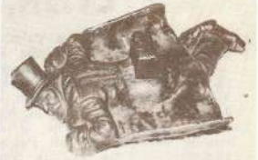
Kokmuižas pelnutrauks.

Ap I pasaules karu barons muižu atstājis un vairs atpakaļ nbraucis. Bēt kokmuižnieki nu varējuši ņemt no kungu mājas ko sirds kārojusi. Stiepuši ar. Kalējs, kura slīmgais puika jau bija pametis šo pasauli, piemēlī pagēmis dēla darinājumu. Vēlāk tas nonācis jau minētā Indriķa Zīles rokās, pēckāra gados glabājies Leņina kolhoza kantora telpās, bēt, pava-