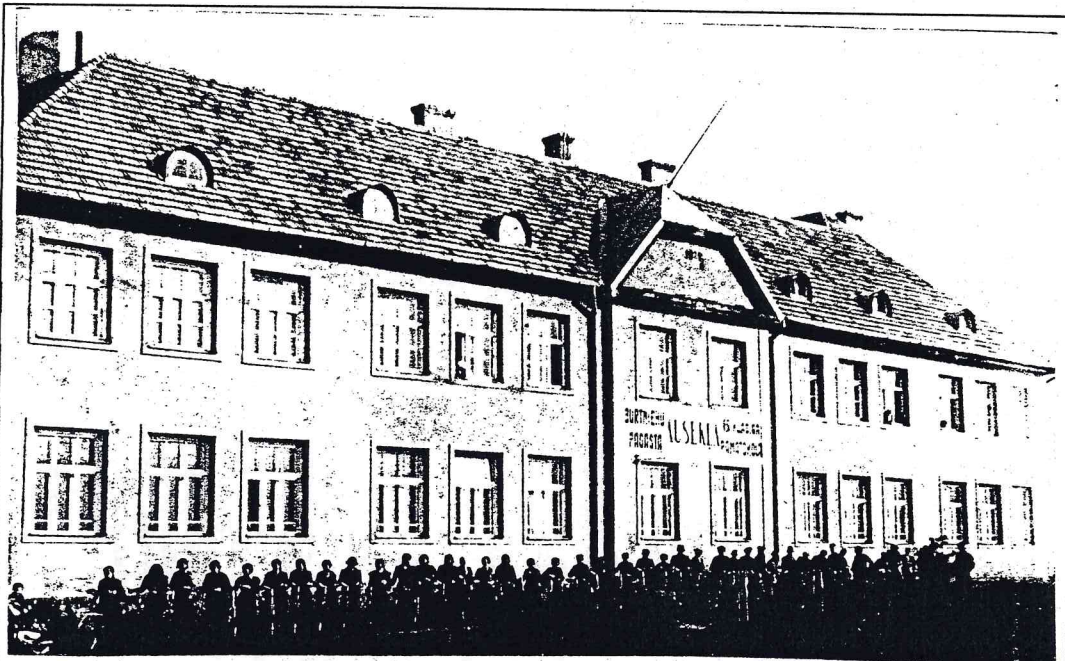
25.04.1939. Burtnieku skolas skolēni ar divriteņiem devās ekskursijā uz Zilokalnu. Vai pēc 60 gadiem mēs būtu gatavi šādam braucienam?