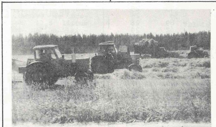
Attēls no lopbarības sagatavošanas.