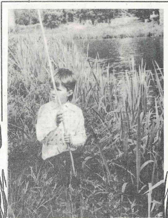
... cerībā Sēļu ciema centra dīķī iegūt "lielo lomu".