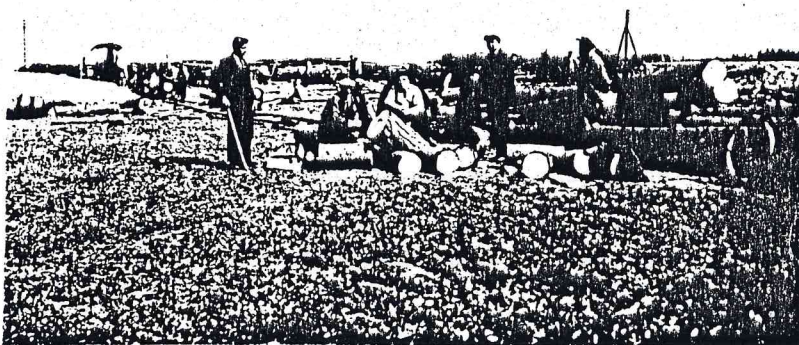
1937. g. rudenī