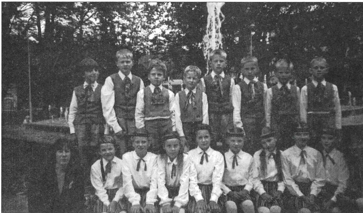
Skolēni dziesmu un deju svētkos Rīgā.

25. augustā – pēdējais brīvlaika pasākumus «Svētki bērniem». Kaut laika apstākļi nepavisam nelutināja, dalībnieku pulciņš bija itin prāvs. Bērni sacentās riteņbraukšanā, portfeļa mešanā, šautriņu mešanā, spilvenu kaujās, šķēršļu stafetē, tautas bumbā, zīmēja uz asfalta. Pasākums noslēdzās ar kopīgu kļiņģeru tiesāšanu.