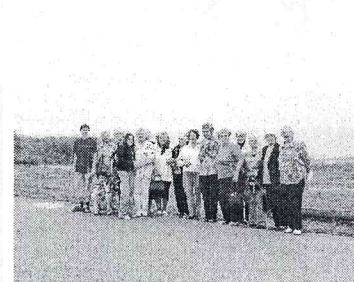
Aiz mums slavenais Peipuss