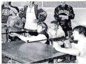
Vai trāpīsim zaķītim...