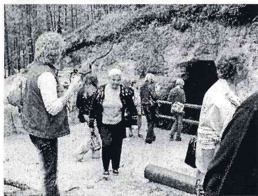
Lielākās baltās smilšu ieguves alas Baltijā (kādreiz)