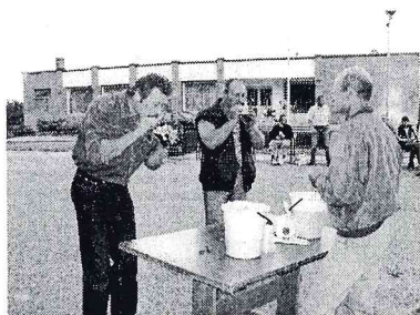
Kurš ātrāk ?

Bibliotēkā līdz 1. oktobrim var apskatīt un pasūtīt pensionāru ekskursijas un ugunsdzēsēju balles fotogrāfijas. Cena pa fotogrāfiju Ls 0,20.