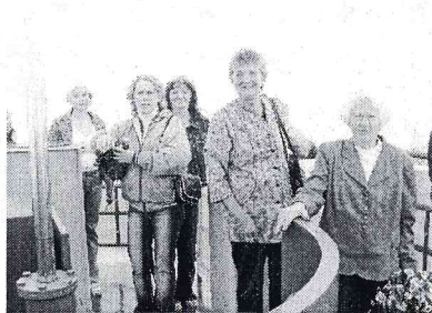
Miglainā Munameģa tornī