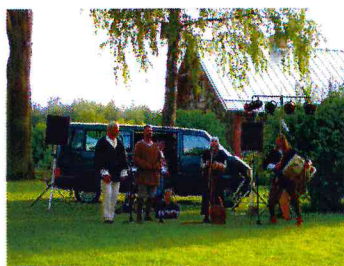
Folkloras kopa "Delve"