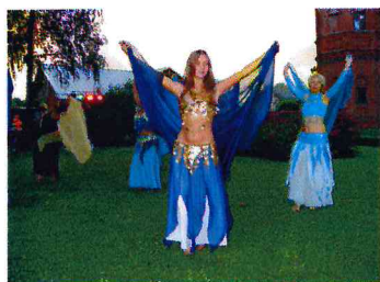
Vēderdejojājas no Salacgrīvas

Saietu konferenci atbalsta: Limbažu rajona padome, Limbažu pilsētas dome, Vidrižu pagasta padome, Limbažu Galvenā bibliotēka, Ziemeļvidzemes biosfēras rezervāts, Valmieras bibliotēka, Eiropas Komisijas informācijas punkts EUROPE DIRECT Valmierā, Cēsu Centrālā bibliotēka, AS DnB NORD Banka, Vidrižu pagasta bioloģiskā saimniecība "Sautlāči", fitoterapeits Jānis Ulmis, Bīriņu Pils, Vidrižu pagasta folkloras kopa "Delve" un modes deju grupa "Spieķītis", vēderdejojāju grupa no Salacgrīvas "Hasana" un citi.