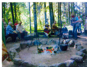
Saieta-konferences noslēgums dendroloģiskā parkā kopā ar folkloras kopu "Delve" un zāļu tēju un bērzu sulu.