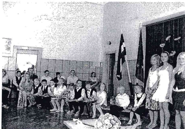
Skolēnu skaitā tiek uzņemti pirmklasnieki