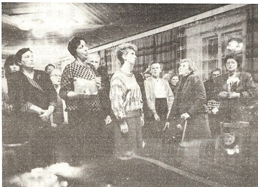
MŪRMUIŽAS TAUTAS UNIVERSITĀTES NODARBĪBĀ.