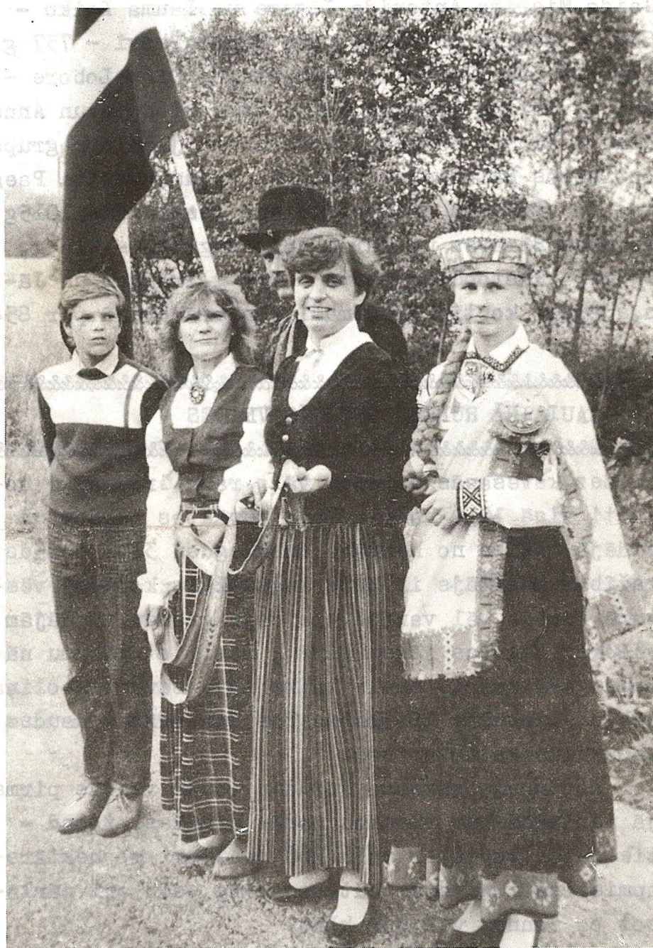
MĒS ESAM VIENOTI UZ BALTIJAS CEĻA. 1989. gada 23. augusts.