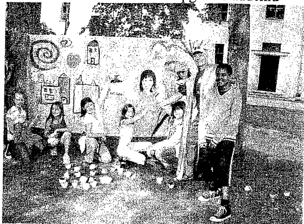
Bērni no Brēmenes