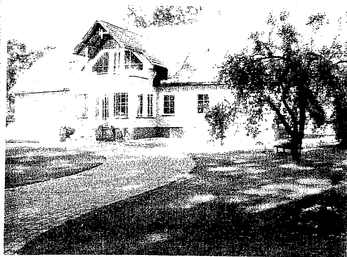
Viena no pagasta sakoptākajām sētām „Druļi”

Pamatojoties uz Kauguru pagasta sakoptākās sētas vērtēšanas komisijas 20.08.2006. protokolu, Kauguru pagasta padome NOLEMJ: