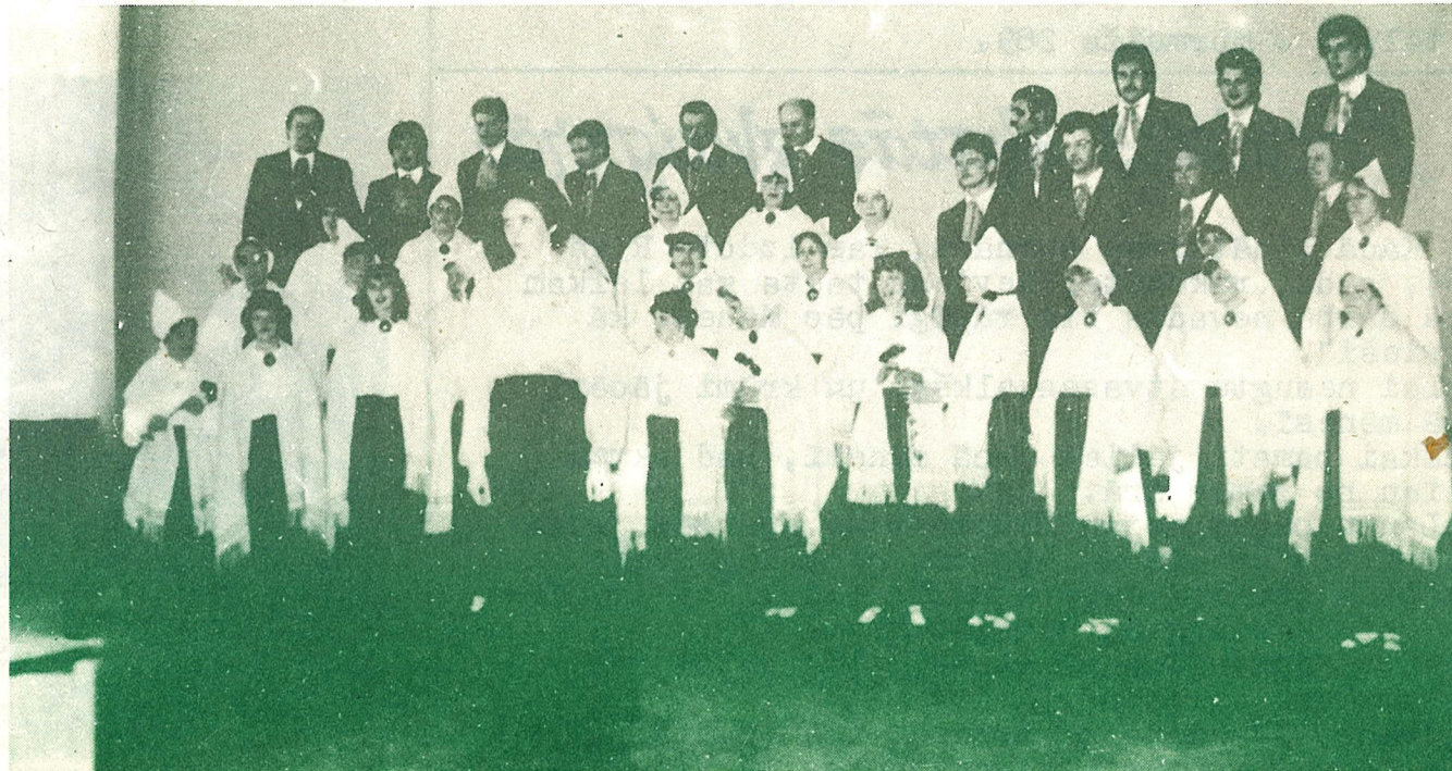
KAUGURU KORIS SKATĒ.