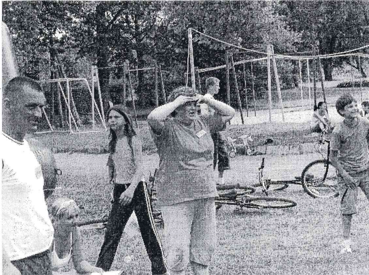
Līdzjutējos arī tiesneši

Sacensību gaitu filmēja Veneranda Logina, fotografēja Aleksejs Kozīņecs. Sacensību fotoreportāžu varējāt vērot planšetēs pie pagasta padomes.