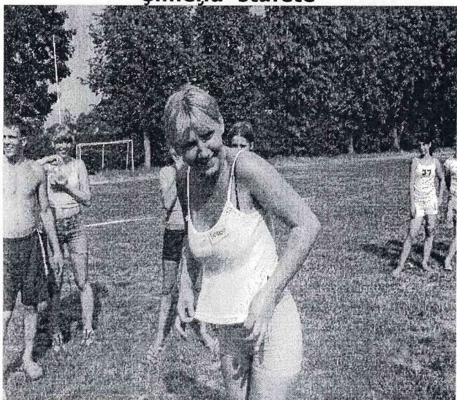
Pēc ūdens maisiņu mešanas sacensībām

Sestdien, 8. jūlijā notika gadskārtējie pagasta sporta svētki.