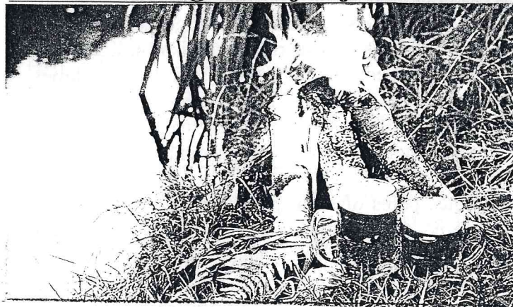
/ Vēsma Kokle- Līviņa/