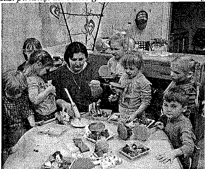
✍ Ineses teksts un foto