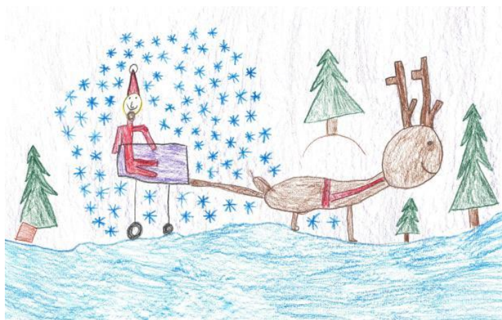
Alises /6.g.v./ zīmējums

Uz šo jautājumu atbildes sniedz piecgadīgie Pasacēni.