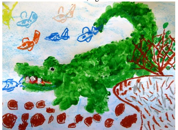
Mikusa Tīģeris un Kristiana Krokodils

Tika zīmēti gan zaķi ar saviem gardumiem, - burkāniem, gan ezītis, kurš nes ābolu, un pat tik eksotiski dzīvnieki kā lauva, tīģeris un krokodils!