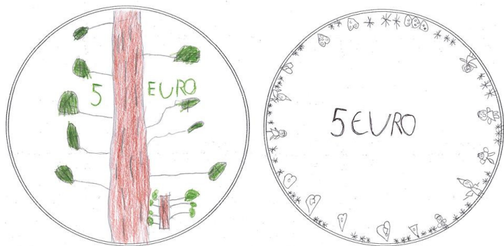
Robija un Emīlijas piedāvājums 5 eiro monētas izskatam

Iesūtītos darbus vērtēs Latvijas Bankas monētu dizaina komisija līdz 13.februārim.