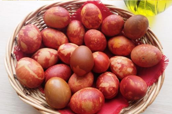
Inetas teksts, Agitas foto