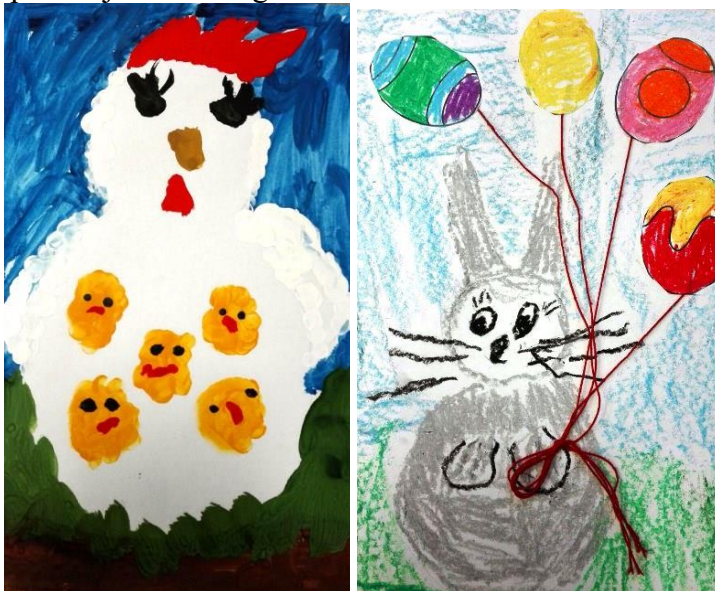
✍ Gitas teksts

Konkursa bildes bija apskatāmas un balsojums notika līdz pašam marta beigām. Turam ikšķus par Pasacēniem! Iespējams, ka kāds no viņiem iegūs konkursa galveno balvu – “Līvu akvaparka” apmeklējumu savai ģimenei.