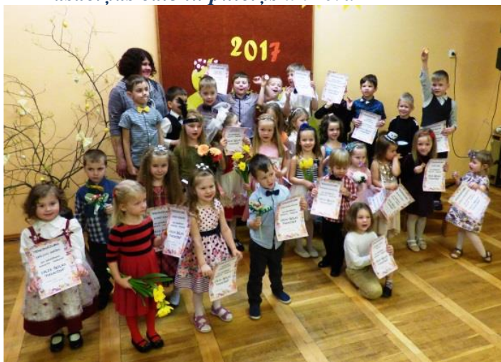
Inetas teksts un foto