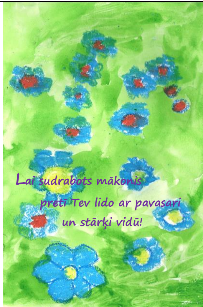
Deivida Liepiņa /6 g.v./ zīmējums