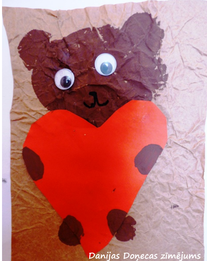
Danijas Doņecas zīmējums